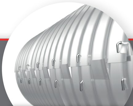
Gancho estándar para las alcantarillas de Ø0.45 a Ø0.90 m

Fabricamos productos de alta calidad que se instalan en forma rápida y segura.